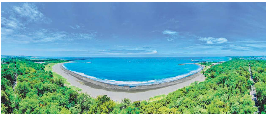
立驛國際有限公司